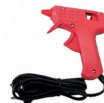
Un pistolet à colle

Au préalable, Réalisez 25 pompons de tailles différentes avec le Pompon Maker. Faites-en des unis, des bicolores, des mouchetés.