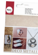
Pochette de feuilles d'or