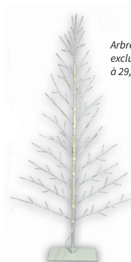
Arbre lumineux : une exclusivité Creacorner à 29,99€